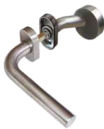
In 101/265 Ov