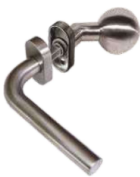
In 101/262S Ov