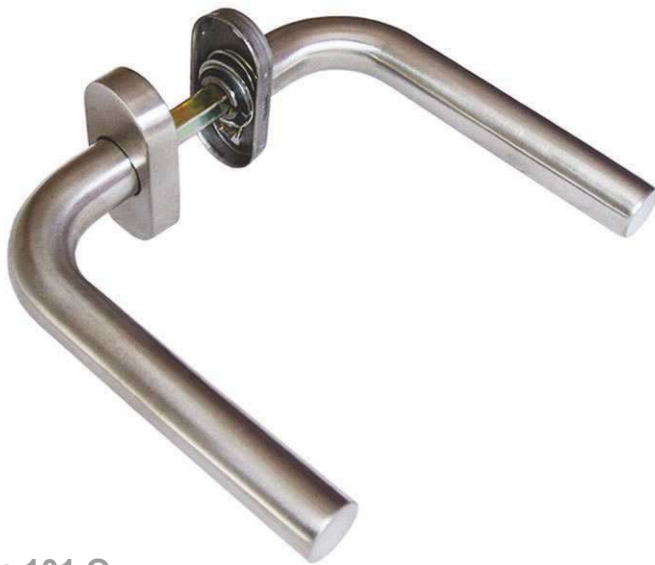
In 101 Ov