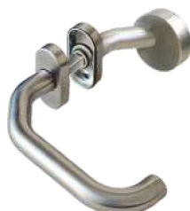
In 104/265 Ov