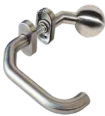
In 104/262S Ov