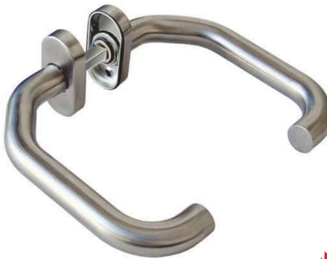
In 104 Ov