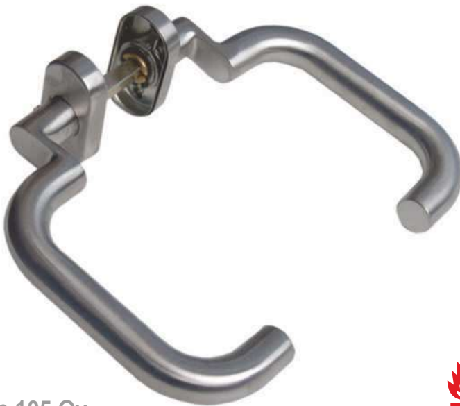
In 105 Ov