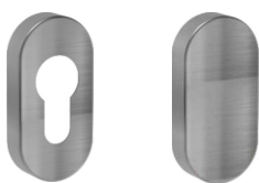
In 130 Ov In 131 Ov