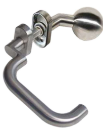
In 105/262S Ov