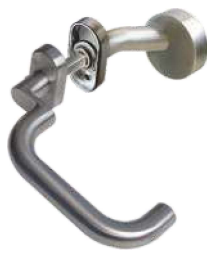
In 105/265 Ov