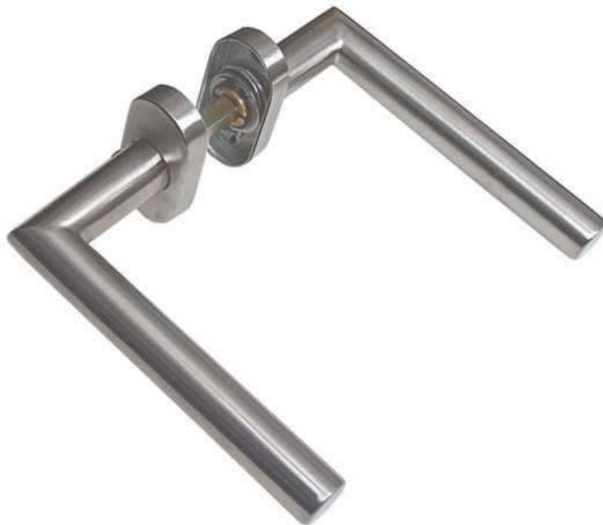
In 106 Ov