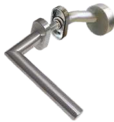
In 106/265 Ov