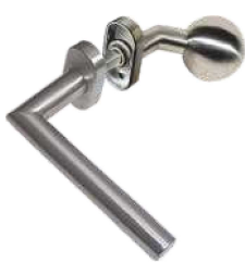
In 106/262S Ov