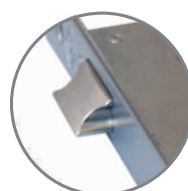
Uniwersalna zapadka (lewa/prawa).