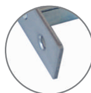
Blacha czołowa ze stali nierdzewnej.